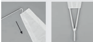
Doppellagig / Double-sided